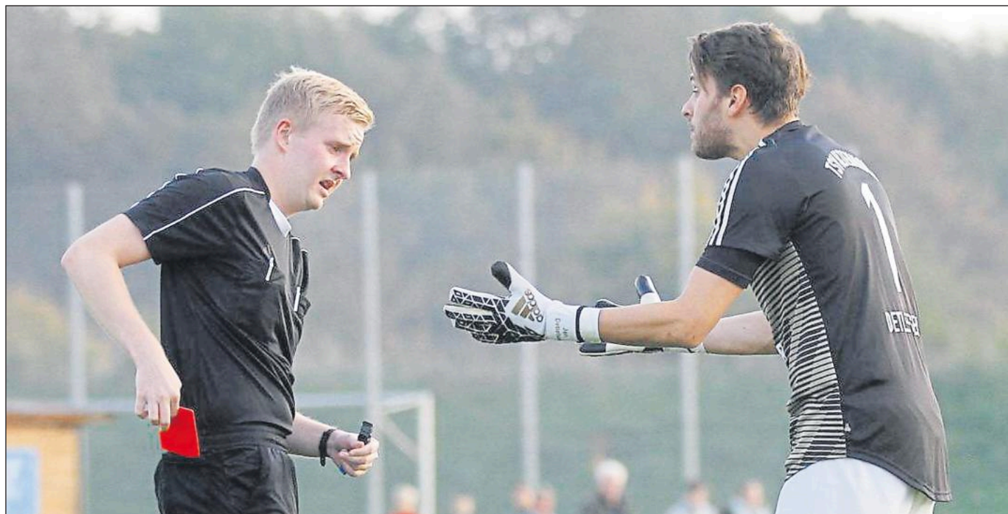
Aus-Zeit: Eine Rote Karte zieht in jedem Fall eine Sperre nach sich.